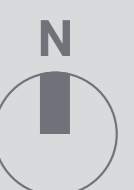
projekt: Madzińczakowski zdjęcia i opisy: Tomasz Starczyński (MUP)

Razem tworzymy Muzeum Józefa Piłsudskiego w Sulejówku!